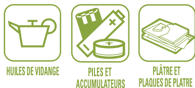
HUILES DE VIDANGE