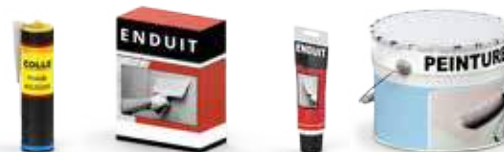
Bricolage et Décoration

Les déchets issus des produits d'entretien, de bricolage et de jardinage sont à apporter en déchèterie.