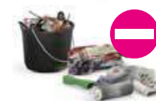
Les matériaux souillés...