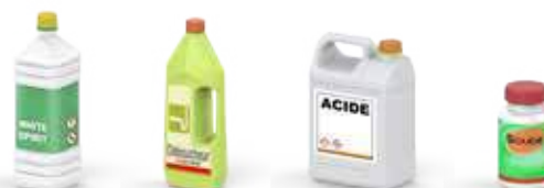
Produits spécifiques de la maison