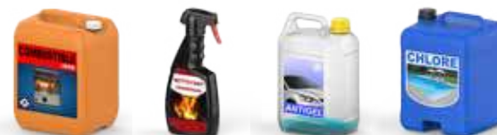
Cheminée et Barbecue, Entretien du véhicule, Entretien de la piscine...