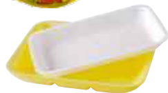
Barquettes en polystyrène