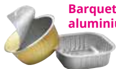
Barquettes en aluminium