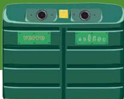
Pots et bocaux