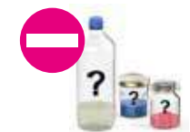
Les produits non identifiés