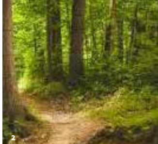
2. Le bois du Laring