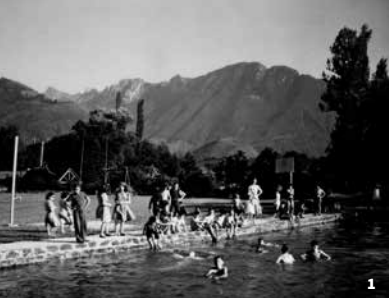
1. Mai à Vélo la piscine de Bedous