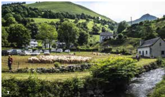
7. La transhumance à Lourdios-Ichère