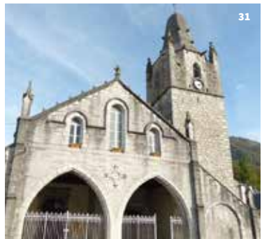
30. Août 1944, quand la vallée d'Aspe se libère