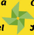
Tableau de feu